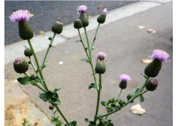
Chardon à pédoncules nus, Carduus defloratus

Emblème de l'Écosse, le chardon aux ânes est aussi l'emblème de la ville de Nancy et de la Lorraine (devise des ducs de Lorraine : « Qui s'y frotte, s'y pique »).